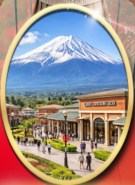
Gotemba Premium Outlets