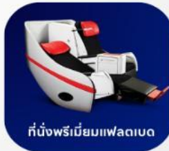
ที่นั่งพรีเมียมแฟลตเบด

บริการอาหารร้อน และ น้ำดื่ม บนเครื่อง ขาไป และ ขากลับ