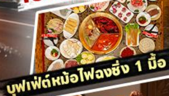
บุฟเฟ่ต์หน่อไพลงชิง 1 มื้อ