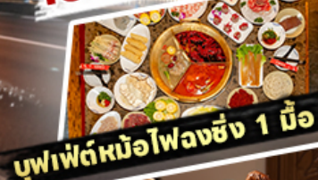
บุฟเฟ่ต์มือโหลงซิง 1 มื้อ