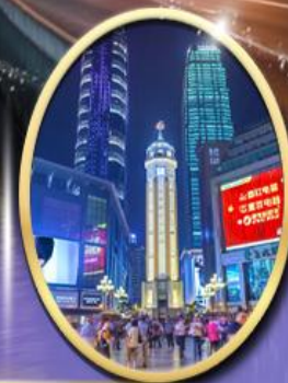
ถนนคนเดินเจี๋ยฟางเป่ย์