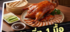
เปิดปักษ์ 1 มื้อ