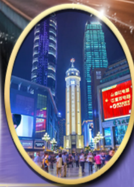
ถนนคนเดินเจียฟางเป็ย