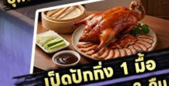
เปิดปากถึง 1 มื้อ

พักรูม 4 ดาว 3 คืน ไฮไลท์ สุดว้าว! ขึ้นลิฟต์แก้วชมความอลังการ กลางหุบเขา