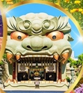
ศาลเจ้านันบะ ยาชากะ