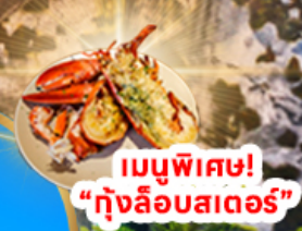
เมนูพิเศษ! "กุ้งลือบสเตอร์"