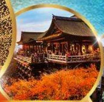
วัดคิโยมิสึ