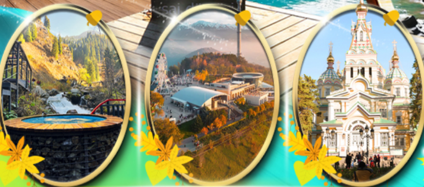
Alma Arasan Gorge Kok Tobe Zenkov Cathedral

เที่ยวครบทุกไฮไลท์ กรุ๊ป 15 ท่าน ไฮไลท์ พิเศษ! พักโคลโซ 1 คืน พักอัลมาตี 3 คืน