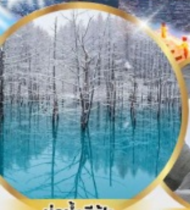
บ่อน้ำสึฟุ