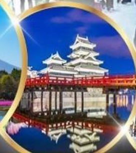
ปราสาทมัตสึโมโตะ