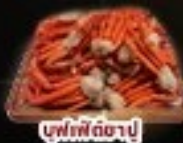
บุฟเฟ่ต์ฮอตพ็อต