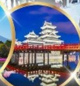
ปราสาทมัตสึโมโตะ