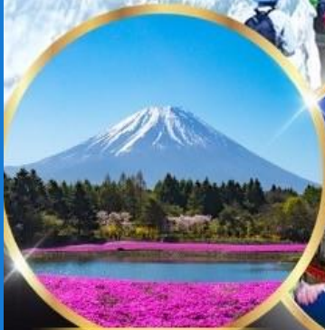
ฟูจิซึบะซาคุระ