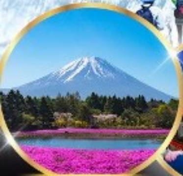
ฟูจิซิมะซากุระ