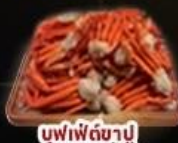
บุฟเฟ่ต์ชาบู