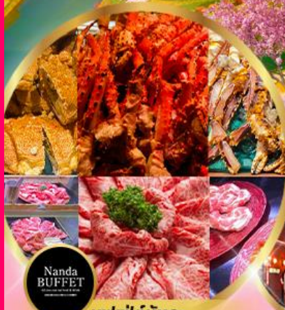
บุฟเฟ่ต์นันทะ ซาปู 3 ชนิด+ ซึฟู้ด + วาทิวA5