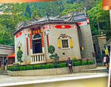
องค์อ้อยส้ม