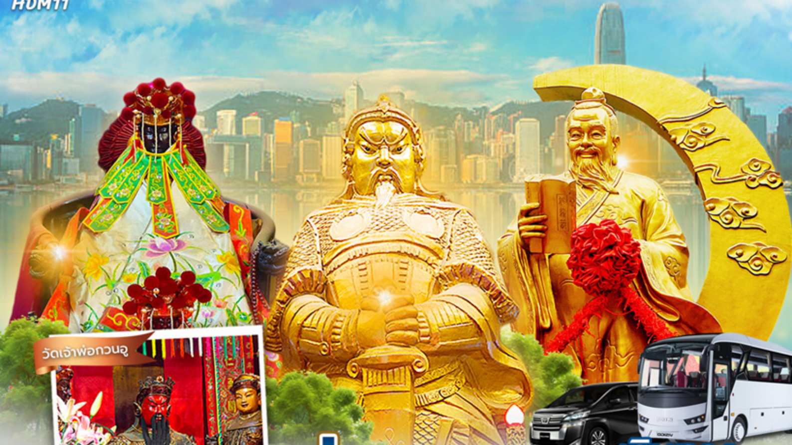
วัดเจ้าพ่อกวนอู