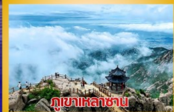
ภูเขาเหลาชาน