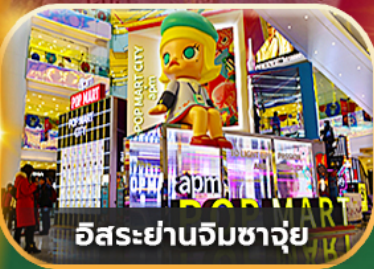
อิสระย่านจิมซาจอย