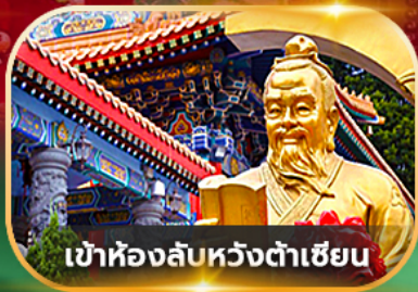
เข้าห้องลับหวังต้าเซียน