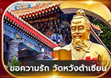
ขอความรัก วัดหวังต้าเซียน