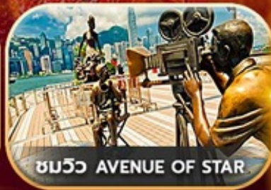
ชมวิว AVENUE OF STAR