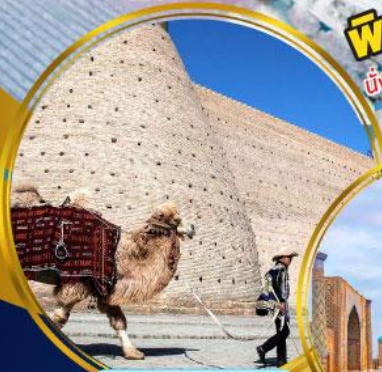
ป้อมปราการบุคาร่า