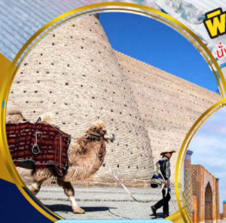
บ่อมปราทราบุคาร่า