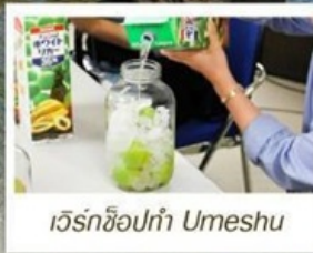
เวิร์กช็อปทำ Umeshu