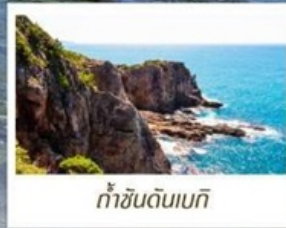
ท่าชินเด็นเบกิ