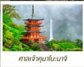
ศาลเจ้าคามาโนะนาจิ