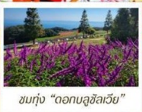
ชมทุ่ง "ดอกบลูซิลเวีย"