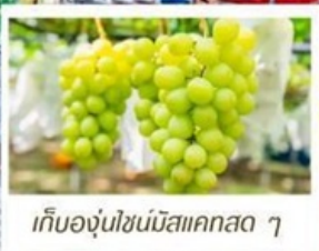
เก็บองุ่นโซนมิสแคสตา ๆ

🇯🇵 เอเชียโทกะ - โอซาก้า (รวมบัตรเข้าสวนสนุก USJ)