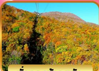
นั้งกระเช้าอุสุซัง