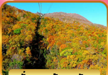
นั่งกระเช้าอุซุซัง