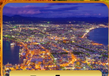
ชมวิวฮาโกดาเตะ