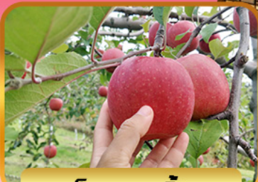
เก็บแอปเปิ้ล