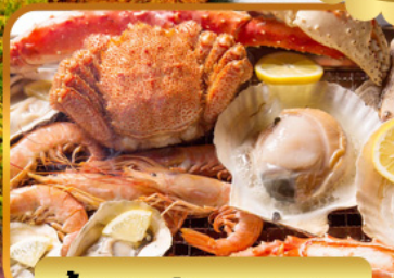
บึ่งย่างร้านดังนั้นตะ