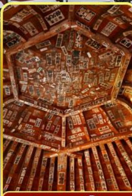
วัดซาชะเอโดะ