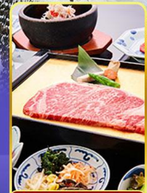
ROKKASEN ฟรีเมียม

ออนเซน 4 คืน นน.กระเป๋า 1 ใบ / 23 กก. 9Days 6Night