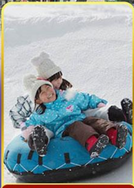
กิจกรรม ぬ ลานสกี