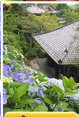
วัดฮาเซเดระ