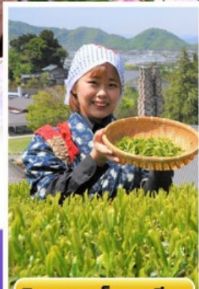
กิจกรรมเก็บชาเขียว