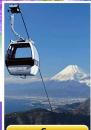
อิซุฟานิรามาวิว