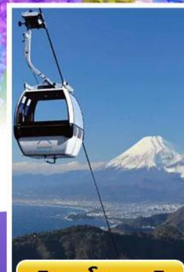
อีซูพานรามาวิว