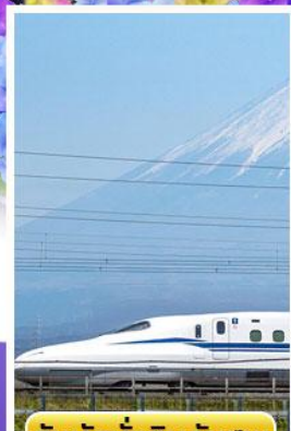
สัมผัสนั่งชินคันเซน