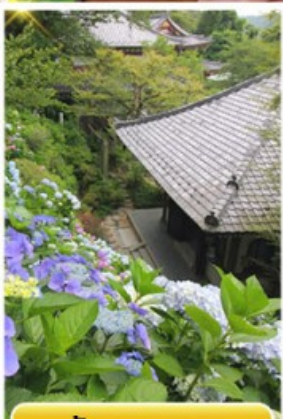
วัดฮาเซเดระ