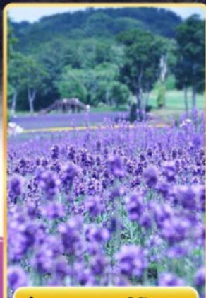
ทุ่งลาเวนเดอร์ทัมบาระ