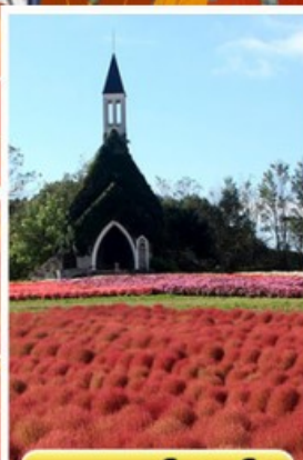
สวนบกกะโนะซาโตะ