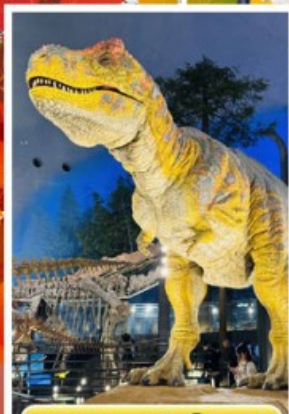
พิพิธภัณฑ์ไดโนเสาร์