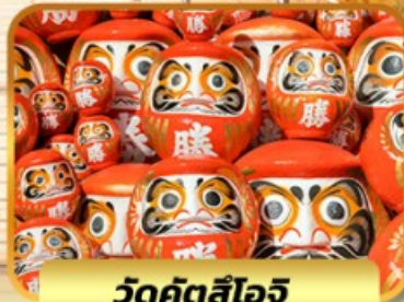
วัดคัตสึโงอิ