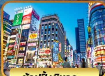
ช้อปบั้งชินจูกุ