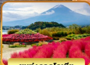
ชมทุ่งดอกโคเชีย