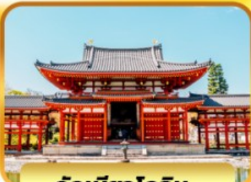
วัดเบียวโดจิน