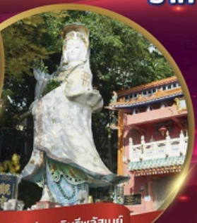
เจ้าแม่กวนอิมรฟ์ลิสเบย์