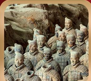
“สุสานจีนซีฮ่องเต้”