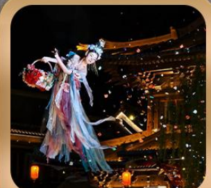
“เมืองโบราณลั่วอี้”