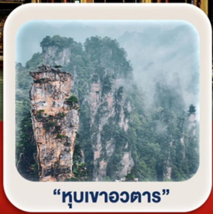
"หุบเขาอวตาร"

นั่งกระเช้าชมภูเขาเทียนเหมินซาน • กำประตูลิ่วหวง • ตึกมหัศจรรย์ 72 ชั้น เมืองโบราณเฟิ่งหวง (ล่องเรือ) + เมืองโบราณฟู่หลงเจิ้น **พักติดเมืองโบราณ 2 คืน** ภูเขาเทียนจื่อซาน • หุบเขาอวตาร • สะพานแก้ว+VR4D • ชมโชว์จิ้งจอกขาว