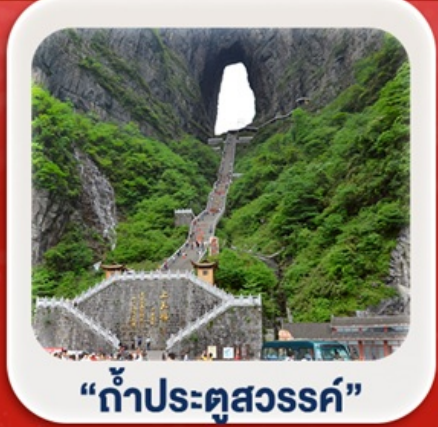
"กำประตูลิ่วหวง"