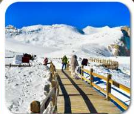
"ต่ากู่กลาเซียร์"

เที่ยวชมความงาม 3 อุทยานชื่อดัง : สีดรุณี • ปี่เผิงโกว ต่ากู่กลาเซียร์ ชมความน่ารักของหมีแพนด้า • จัตุรัสหยางเทียนวู่ ชอยกว้างชอยแคบ • ถนนคนเดินซุนซีสู๋ • POP MART