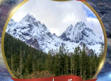
ภูเขาสี่ฤดู