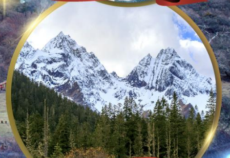
ภูเขาสีดรุณี