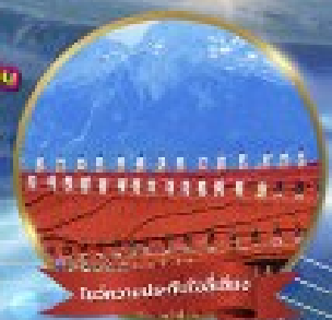
วัดลามะของจ้านหลิน