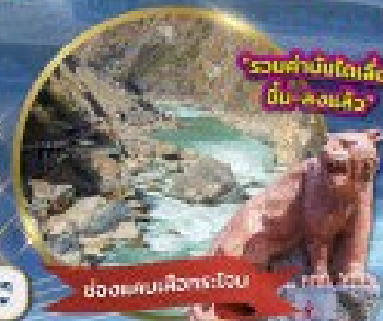
ช่องแคบเสีจกัเอ๋อ