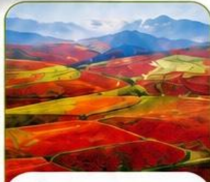
แผ่นดินสีแดงตงชวน