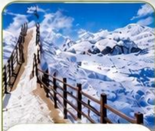
ภูเขาหิมะเจี๋ยจื่อ

✈️ เดินทาง พฤศจิกายน 2569 - กุมภาพันธ์ 2570