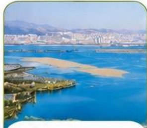
ทะเลสาบเตียนฉือ