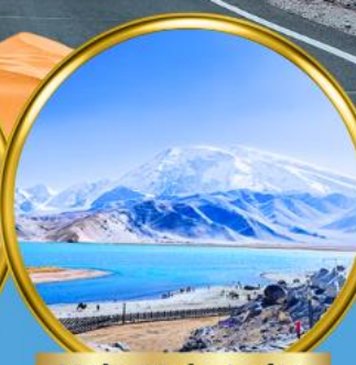
Kala Kule Lake