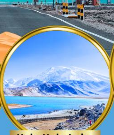
Kala Kule Lake