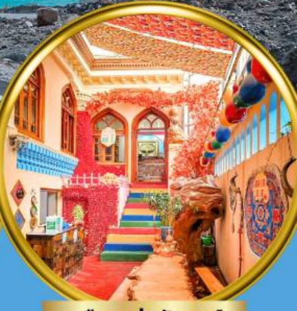
เมืองเก่าคัชการ์