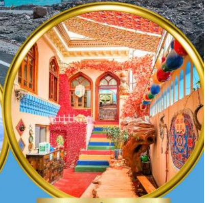
เมืองเก่าคัชการ์