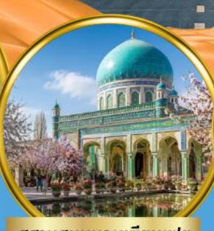
สุสานสมหอมเซียนเฟย