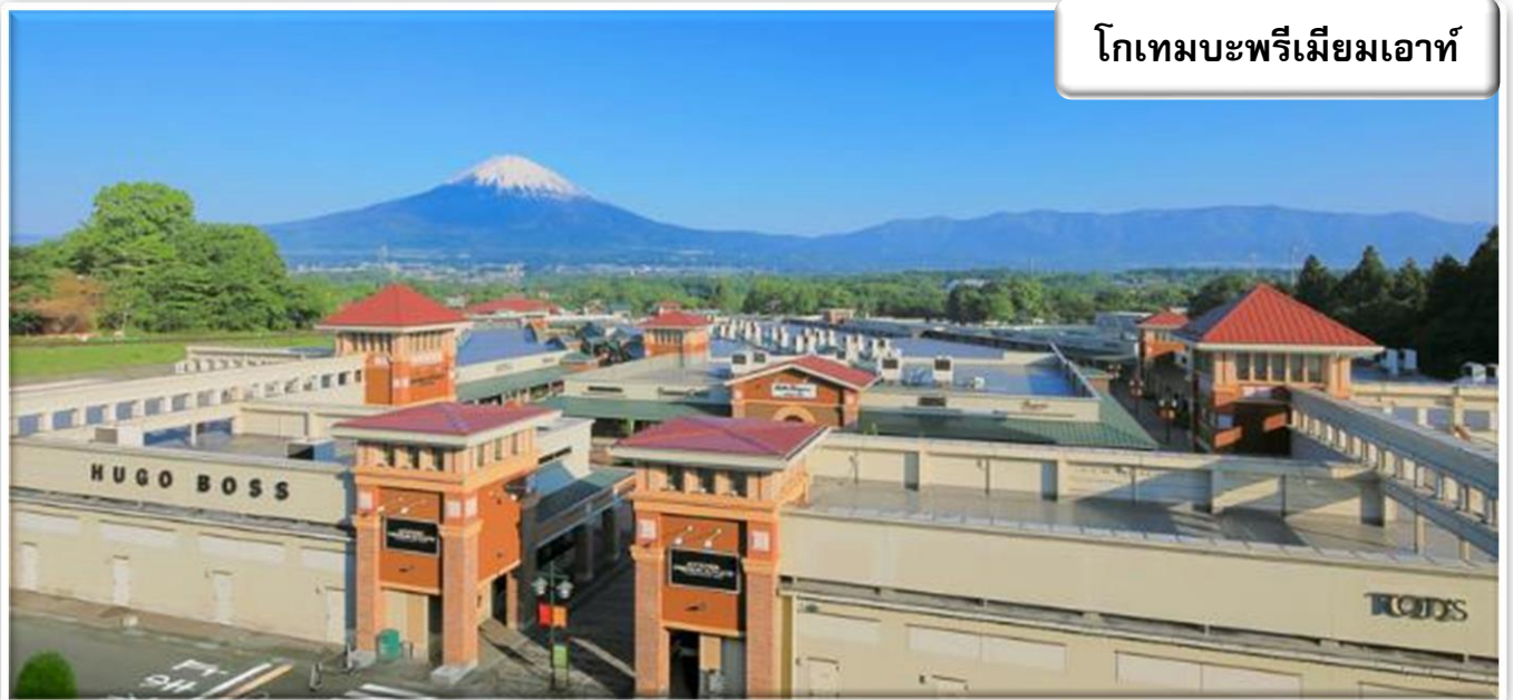
โกเทมบะพรีเมียมเอาท์

สวนดอกไม้ฮามามัตสึ สวนพฤกษศาสตร์ที่อยู่ติดกับทะเลสาบฮามานะ มีทัศนียภาพธรรมชาติที่สวยงามและเต็มไปด้วยดอกไม้พีชพันธุ์กว่า 3,000 ชนิด รวมถึงต้นซากุระ 1,300 ต้น และทิวลิป 5 แสนดอก นอกจากนี้ยังมี "สวนดอกกุหลาบ" กว่า 1000 ต้น และ "สวนฮานะชิโอะ" ที่เต็มไปด้วยพรรณไม้ญี่ปุ่นกว่า 1 ล้านต้น อีกทั้งยังสามารถชมดอกไม้บานาพันธุ์ตามฤดูกาล เช่น ในฤดูใบไม้ร่วงก็สามารถชมโมมิจิ(ใบไม้แดง)ได้