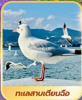
ทะเลสาบเตียนฉือ