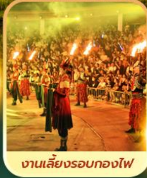
งานเลี้ยงรอบกองไฟ