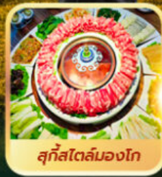
สุกีสโตล์มองโก