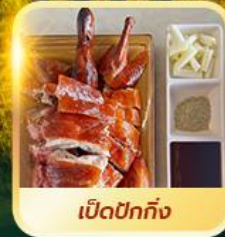
เบ็ดปักกิ้ง