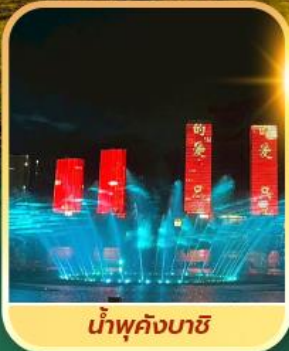
น้ำพุคังบาชิ