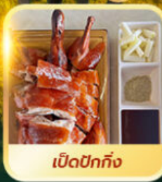
เปิดปีกถึง