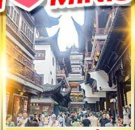
เจียงหวงเมี่ยว