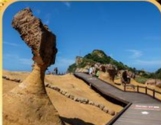
อุทยานหินเหย์หลิว