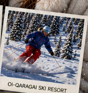
OI-QARAGAI SKI RESORT