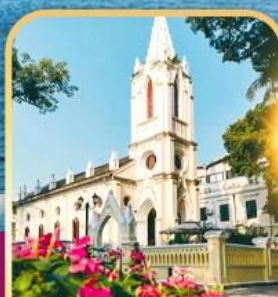
เกาซาเมียน