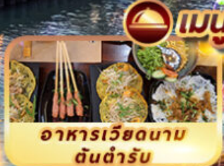
อาหารเวียดนาม ต้นตำรับ