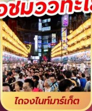
ไถจงไนท์มาร์เก็ต