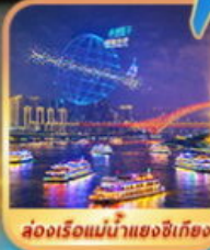
ล่องเรือแม่น้ำแยงซีเกียง