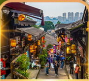
หมู่บ้านโบราณฉือชี่โจว