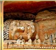
พาคืนพระแกะสลักต้าจู๊