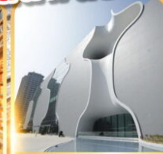
โรงละครโดง