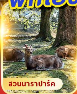
สวนนาราปาร์ค