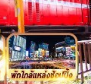
พิกโกเลียแหล่งช้อปปิ้ง