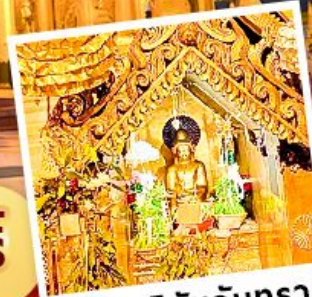
พระสุริยันจันทรา