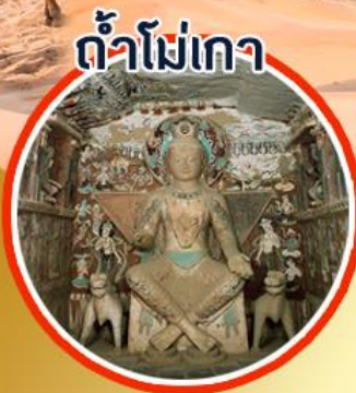
ถ้ำโม่เกา