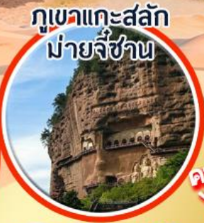
ภูเขาแกะสลัก ม้ายี่ชาน