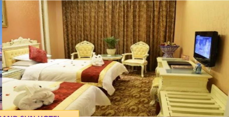
DUNGHUANG: GRAND SUN HOTEL