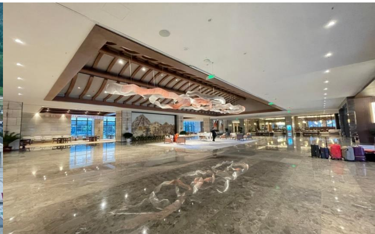
TIANSHUI: MAIJISHAN PEARL HOTEL