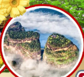
กุชามังกรเสื่อ