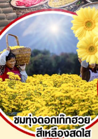
ชมทุ่งดอกเก๊กฮวย สีเหลืองสดใส