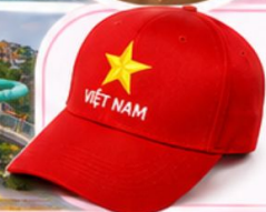
Aquatopia Water Park