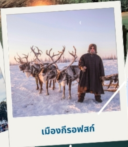
เมืองก็รอฟสค์