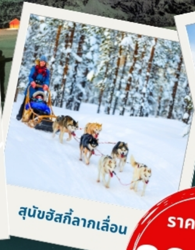
สุนัขฮัสกีลากเลื่อน