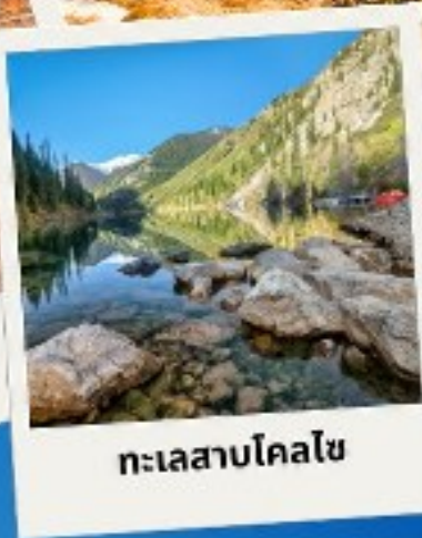
ทะเลสาบโคลไซ