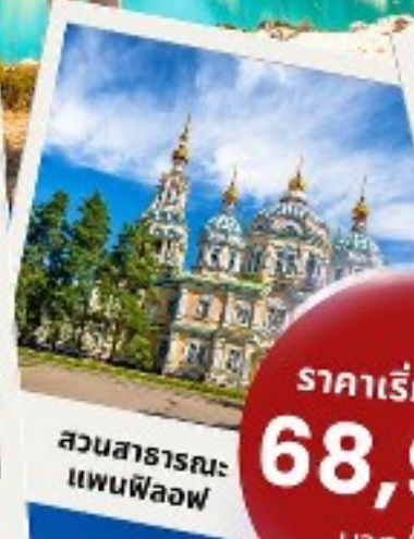
สวนสาธารณะ แพนฟิโลฟ