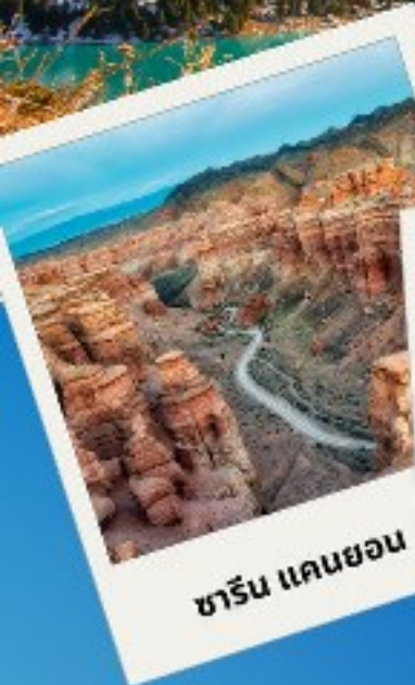
ซาริน แคนยอน