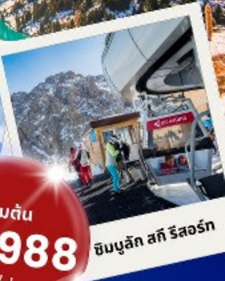
ซิมบูลิก สกี รีสอร์ท